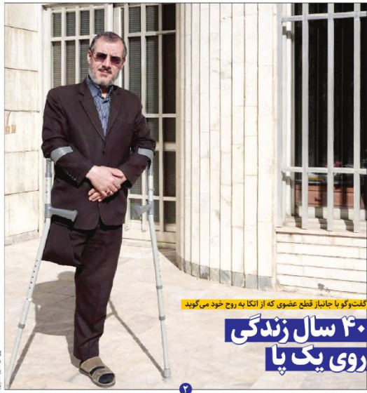
گفت‌وگو با جانباختن قطع عضوی که از انکا به روح خود می‌گوید ۴۰ سال زندگی روی یک پا